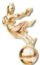
รางวัลอุตสาหกรรมท่องเที่ยว ปี 2553 ประเภทโรงแรมบูติคยอดเยี่ยม กิณีทองคำ